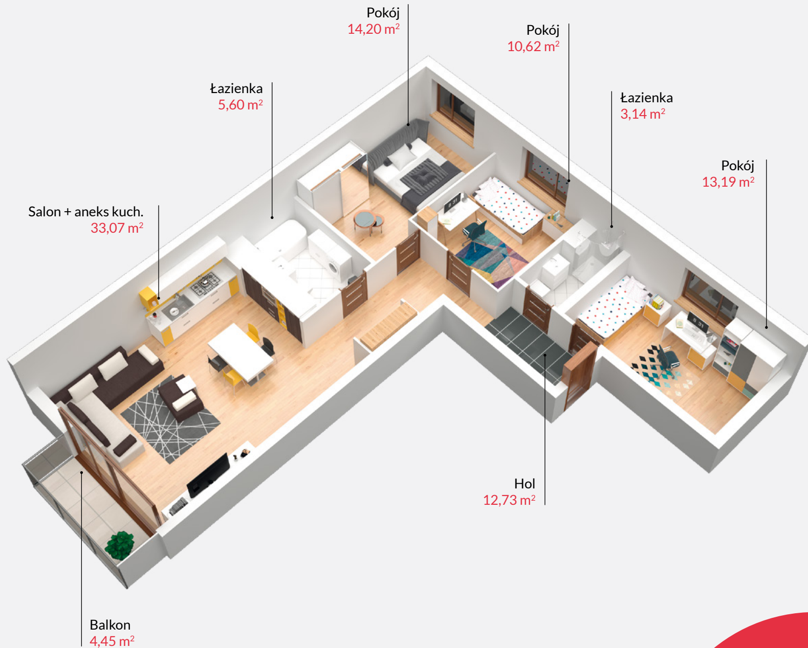
Rzut lokalu zakłada przykładowe umeblowanie pomieszczeń

SPRZEDAŻ MIESZKAŃ: kom.697 850 333 | saskalia@t1.pl