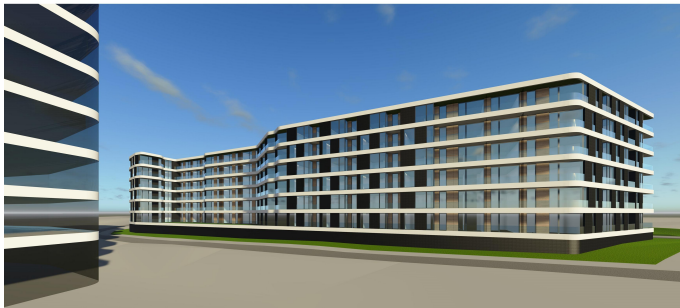
Kraków, ul. Promienistych