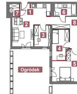
Rzut mieszkania B.O.26

ściany działowe nadające się do demontażu