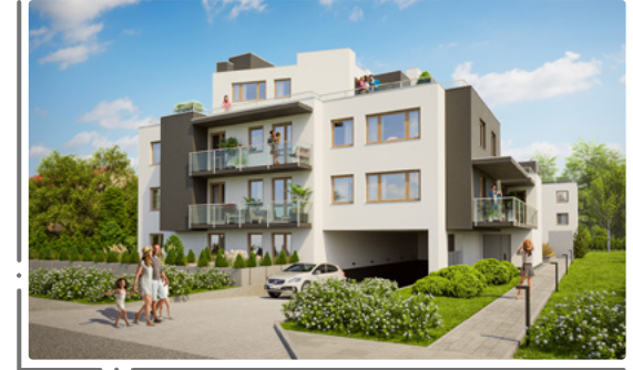
Widok od strony ulicy