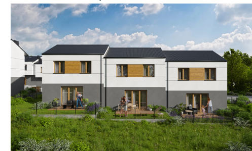
Widok domu od strony ogrodu