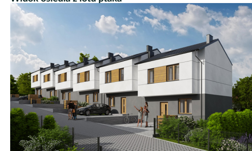
Widok domu od strony ulicy