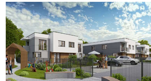
Widok na osiedle od frontu