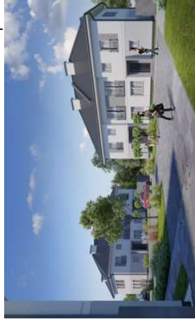
Widok od strony ulicy