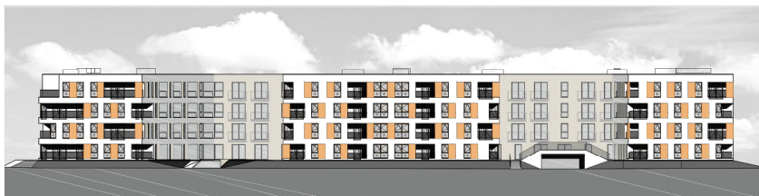
BUDYNEK WIELORODZINNY PRZY ULICY ZIELNEJ WE WROCŁAWIU